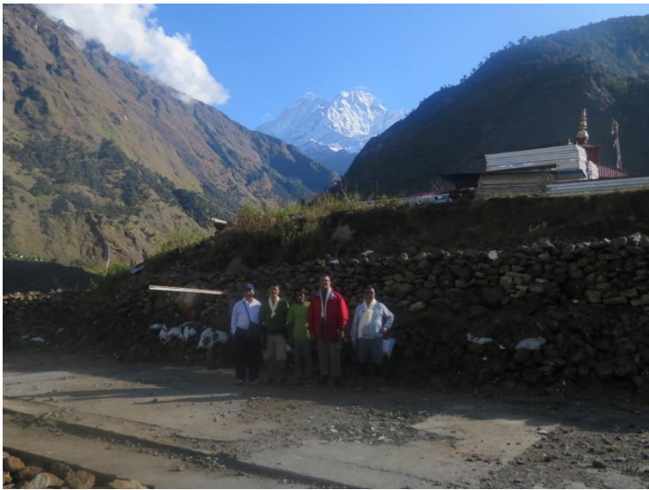
シミガオン学校建設予定地（学校跡地）。