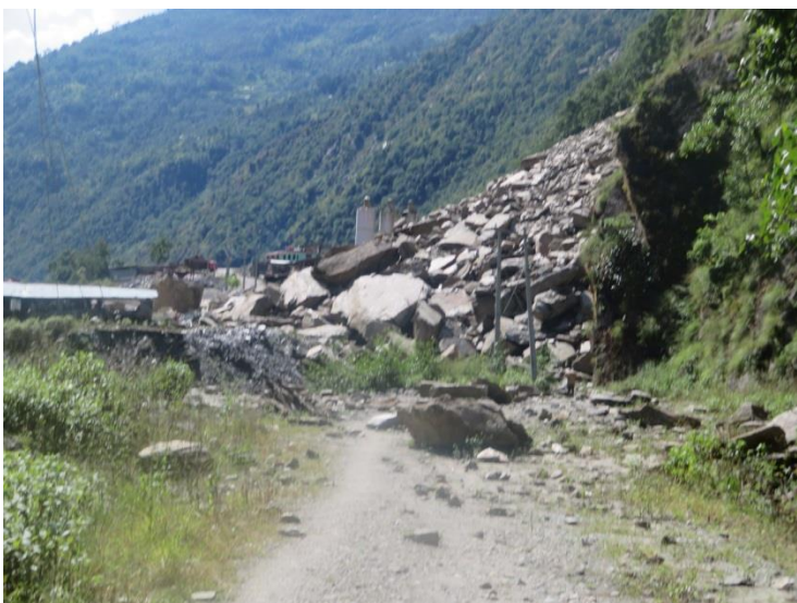
ゴンガール（車道終点付近）。