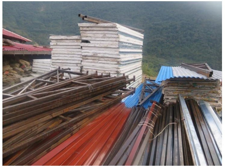
英国製のプレハブ建設資材。