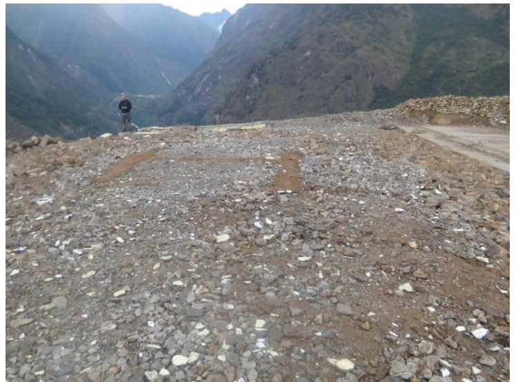
学校敷地（前庭）。震災直後はヘリポートとなった。