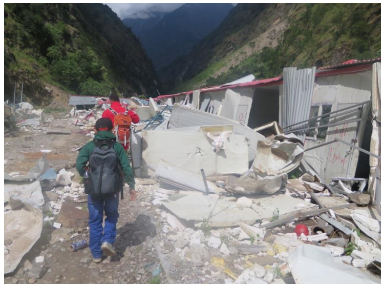
ゴンガール（中国ダム建設事務所）。