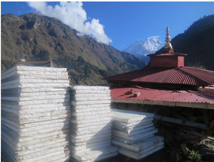
建設資材と崩壊したゴンパ。背景ガウリシャンカール。